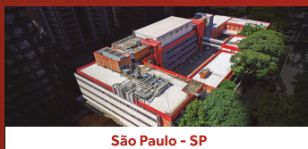
São Paulo - SP

Superamos desafios e evoluímos junto com o setor, impulsionados pelo esforço coletivo de nossos colaboradores. Esse crescimento estruturado foi sustentado por investimentos contínuos, expansão produtiva, adoção de tecnologia e pela construção de relações transparentes e sustentáveis com toda a nossa cadeia.