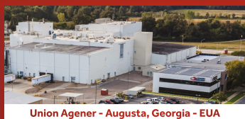
Union Agener - Augusta, Georgia - EUA