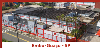
Embu-Guaçu - SP