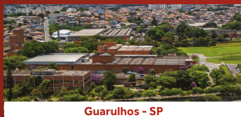
Guarulhos - SP