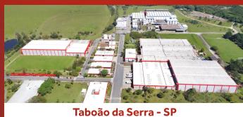
Taboão da Serra - SP