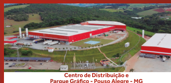
Centro de Distribuição e Parque Gráfico - Pouso Alegre - MG