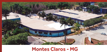
Montes Claros - MG