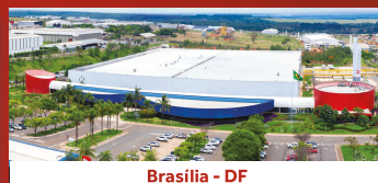
Brasília - DF