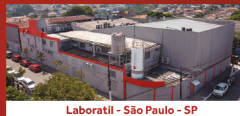
Laboratil - São Paulo - SP