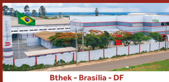
Bthek - Brasília - DF